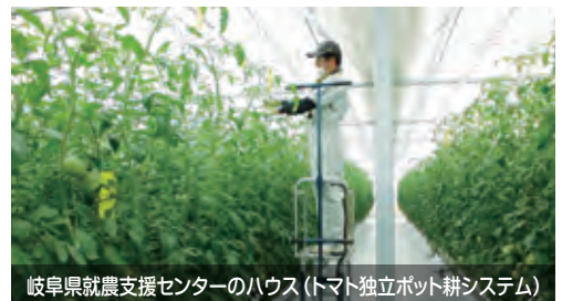
岐阜県就農支援センターのハウス(トマト独立ポット耕システム)