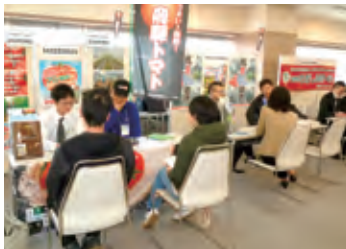
※写真は平成28年2月の相談会の様子